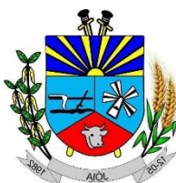
PREFEITURA DE JÓIA