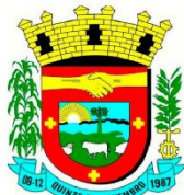
PREFEITURA DE QUINZE DE NOVEMBRO/RS