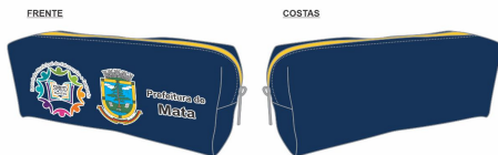
Logomarca: 19,3cm larg x 6cm alt Estojo em Ny600 marinho com acabamento em amarelo. Estampa frontal em cromia. Dimensões: 22cm largura x 8cm altura x 5cm profundidade