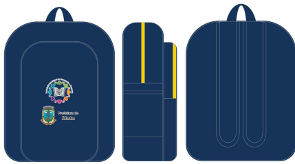
Logomarca: 11,3cm larg x 14cm alt Mochila em Ny600 Marinho, com acabamento em marinho, fechamento em zíper amarelo. Estampa no bolso frontal em cromia. Dimensões: 42cm altura x 33cm largura x 12cm profundidade.