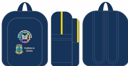
Logomarca: 11,3cm larg x 14cm alt Mochila em Ny600 Marinho, com acabamento em marinho, fechamento em zíper amarelo. Estampa no bolso frontal em cromia. Dimensões: 32cm altura x 26,5cm largura x 12cm profundidade.