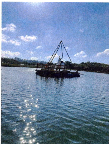
WhatsApp Image 2024-05-20 at 12.59.08 (9).jpeg