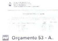
PDF Orçamento 53 - A..