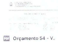
PDF Orçamento 54 - V..