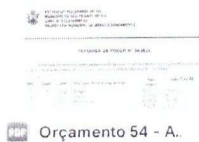
PDF Orçamento 54 - A..