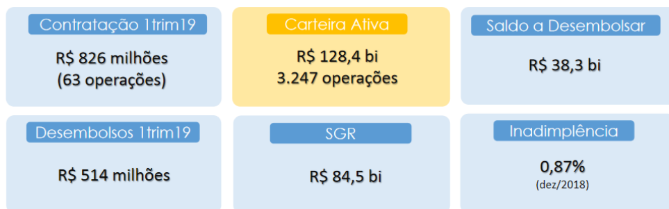
Figura 1 – Carteira Ativa 1º tri 2019.

Essa carteira é composta por mais de 3 mil contratos de longo prazo firmados com os setores público e privado, tanto municípios e suas companhias, quanto estados, companhias estaduais e União.