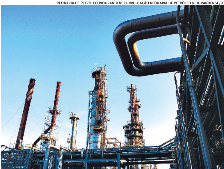
REFINARIA DE PETRÓLEO RIOGRANDENSE/DIVULGAÇÃO REFINARIA DE PETRÓLEO RIOGRANDENSE/JC

O Brasil continua como um dos quatro países de fora da Opep que mais deverão impulsionar o avanço da oferta global de combustíveis líquidos em 2025 e em