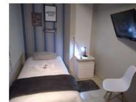
Pousada Carpe Diem