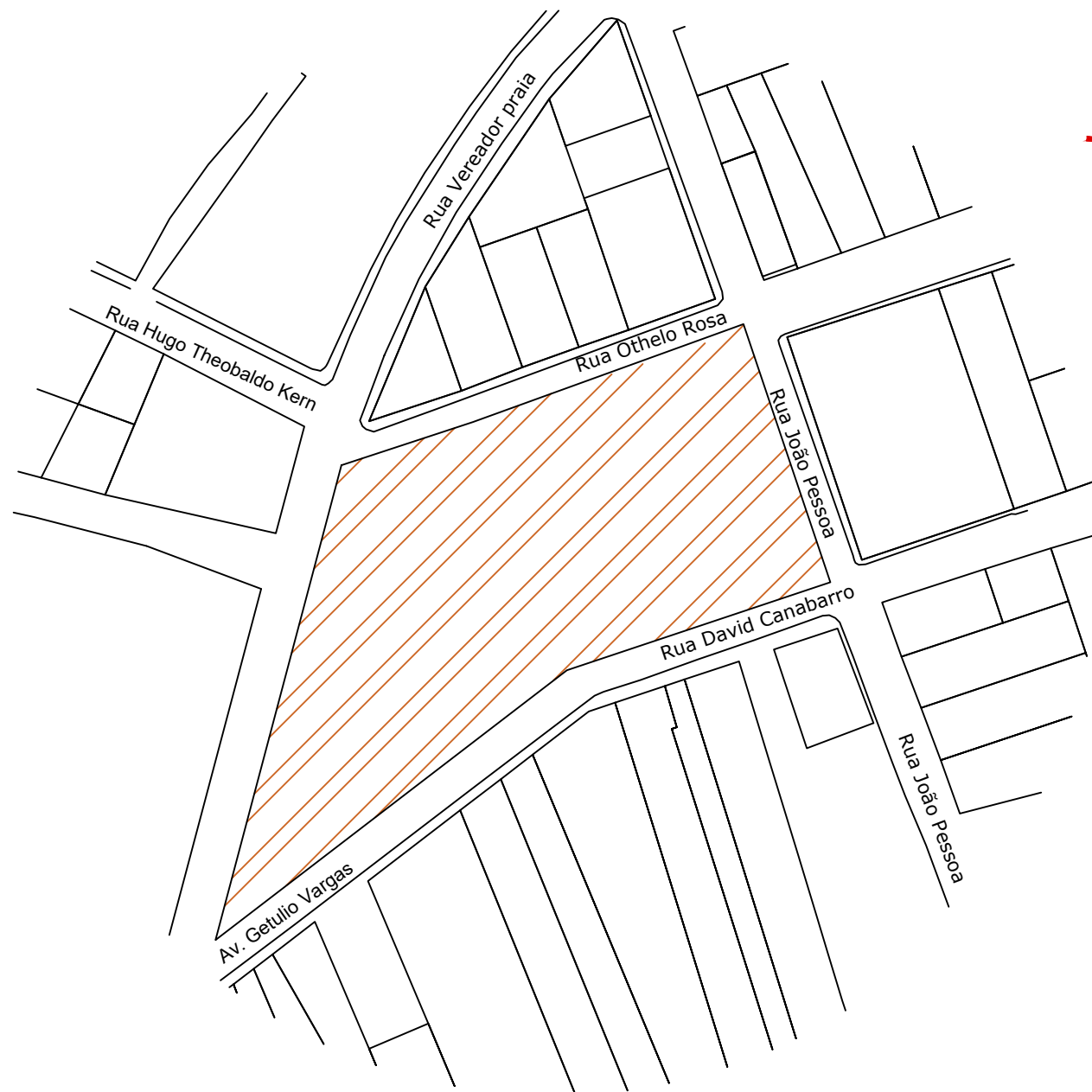
PLANTA DE SITUAÇÃO S/ESCALA