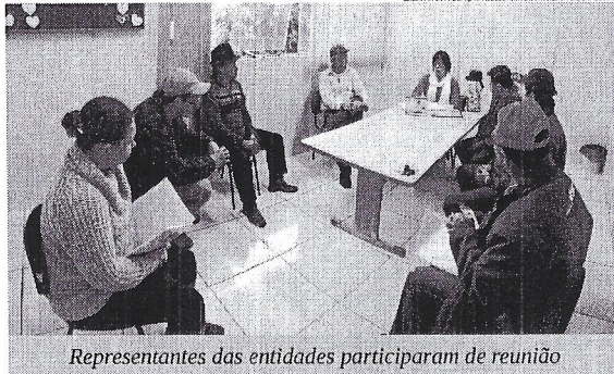
Representantes das entidades participaram de reunião

Representantes da comunidade tradicionalista de Ernestina participaram de uma reunião na quinta-feira (16), na Prefeitura Municipal. As entidades tradicionalistas foram convidadas para a definição da programação da Semana Farroupilha de 2016. Neste ano, o tema escolhido é a "República das Carretas". A programação definitiva deve ser divulgada ao público no mês de agosto. A abertura dos festejos farroupilhas no município deve ocorrer no dia 13 de setembro e o desfile está programado para o dia 01 de setembro. A secretária da