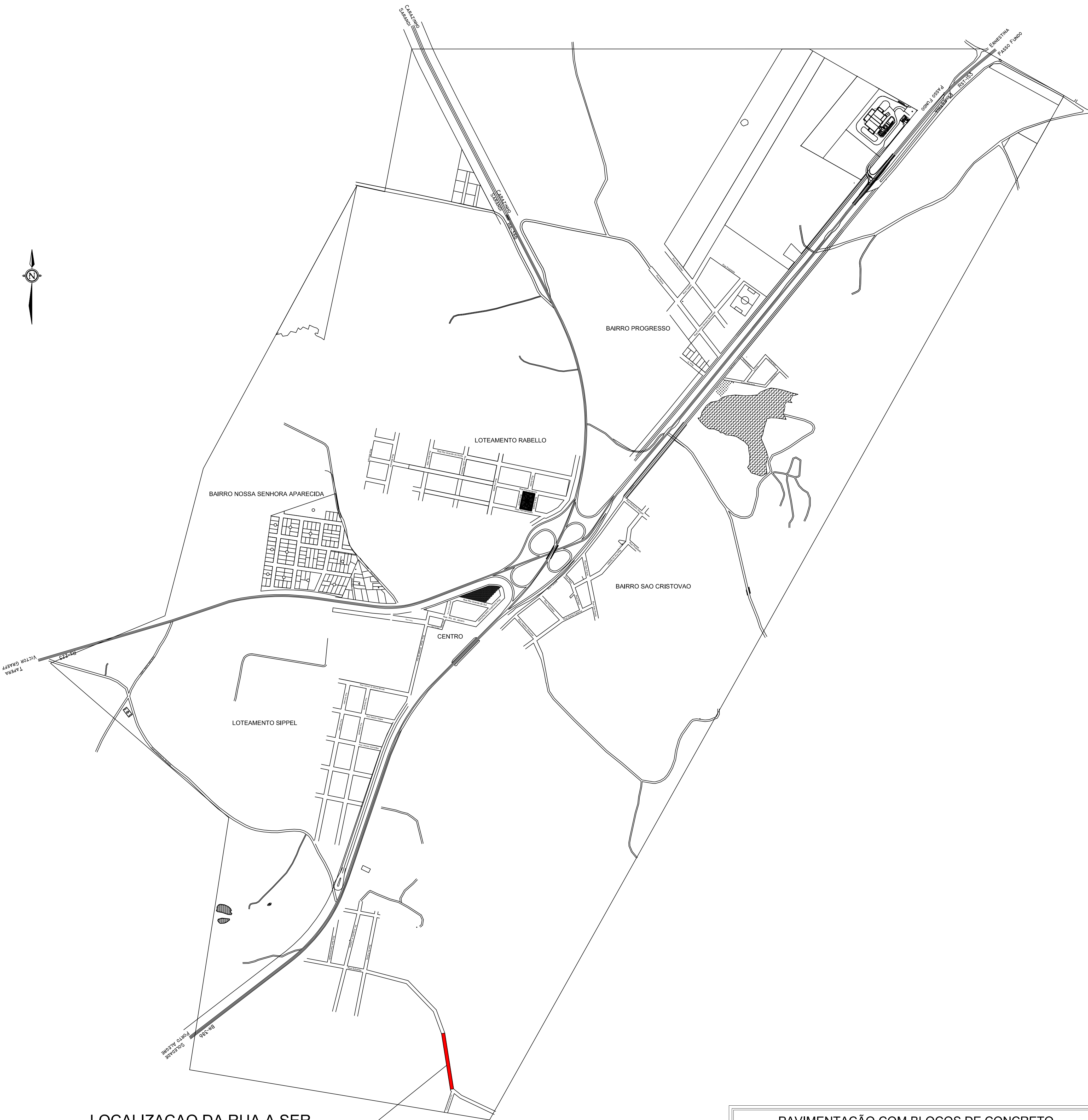
LOCALIZACAO DA RUA A SER PAVIMENTADA EM RELACAO A MALHA URBANA