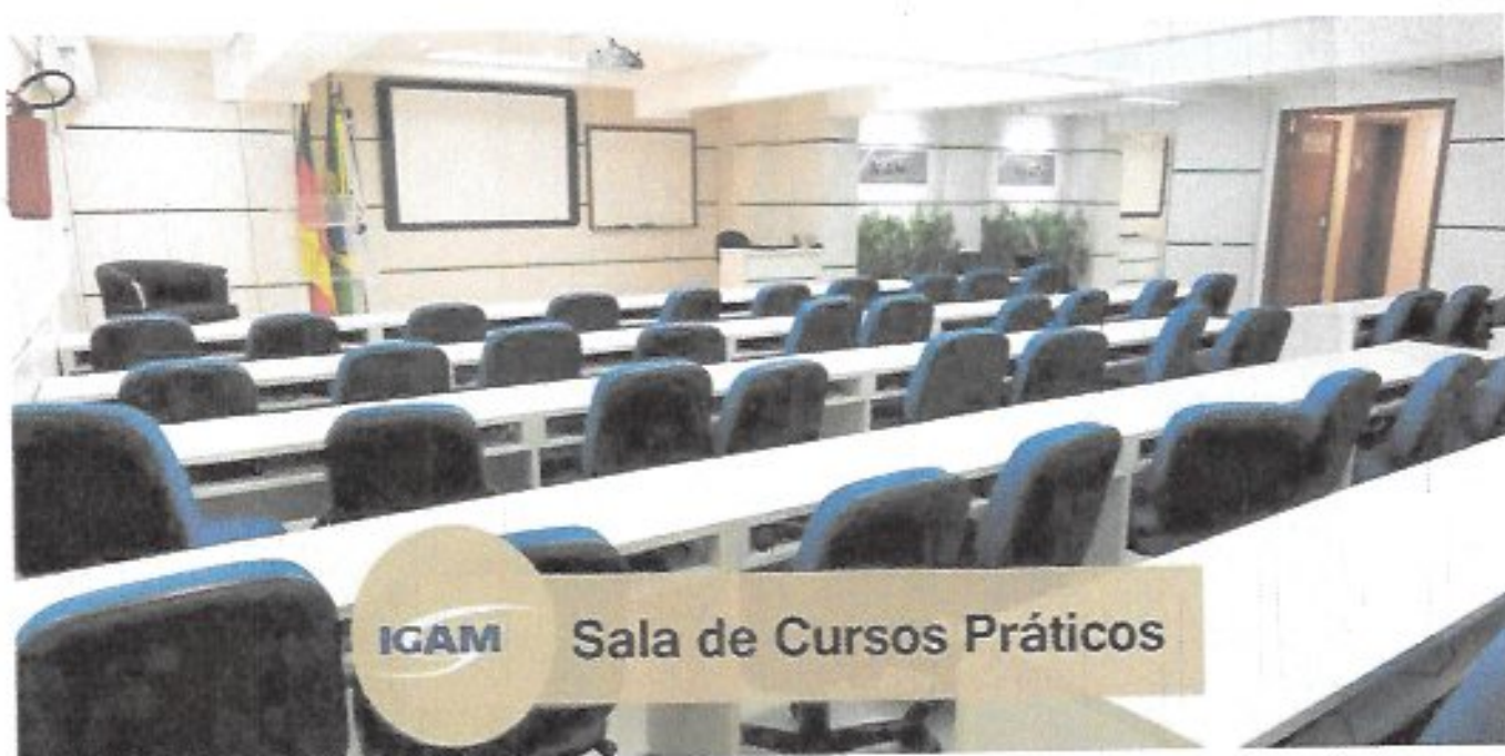
ICAM Sala de Cursos Práticos