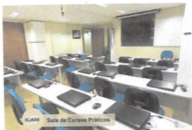
ICAM Sala de Cursos Práticos