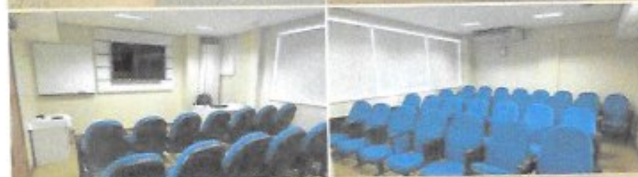
Mini auditório de cursos