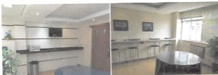
Sala de coffee break 01