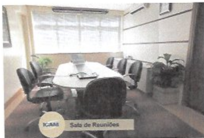
ICAM Sala de Reuniões