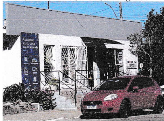
Foto da fachada do Imóvel 03, localizado na Rua Ceará, nº 06, Sala 02, Rabello, Tio Hugo/RS: