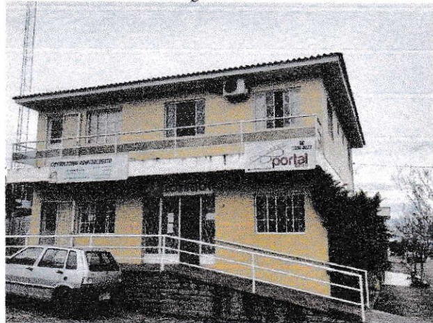
Foto da fachada do Imóvel 03, localizado na Rua Ceará, nº 06, Sala 02, Rabello, Tio Hugo/RS: