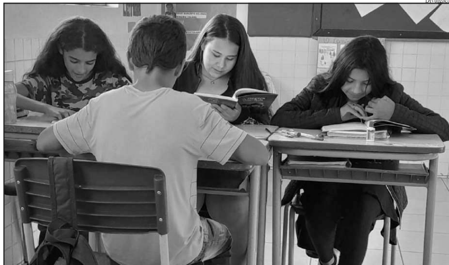
Alunos da Escola Assis Brasil lendo durante a atividade