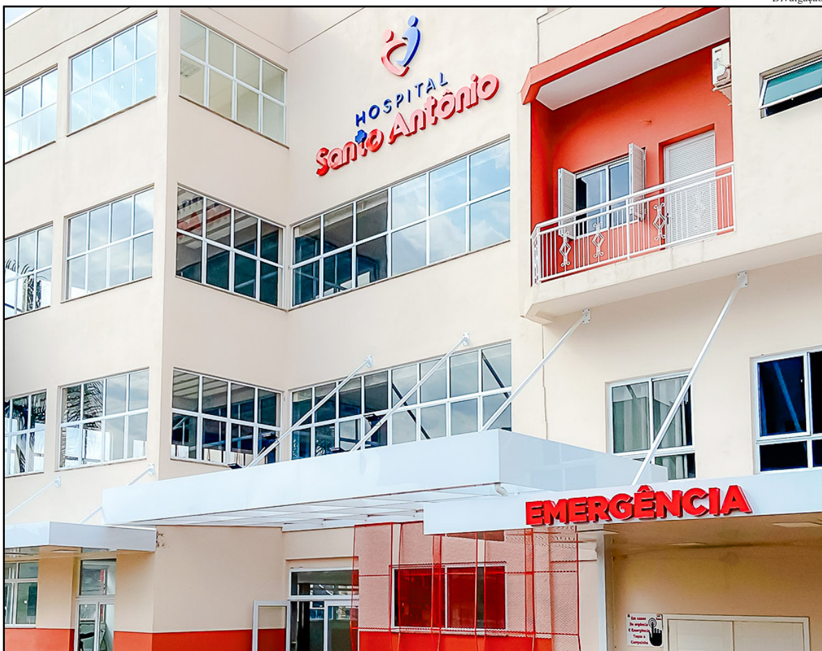
Hospital Santo Antônio de Tenente Portela

No último dia 8 de março, Dia Internacional da Mulher, a Secretaria Estadual da Saúde (SES) celebrou a implantação do SERMulher RS (Serviço Especializado de Referência à Saúde da Mulher), uma iniciativa que já conta com sete unidades habilitadas no estado, incluindo uma em Tenente Portela. A estratégia visa oferecer atendimento especializado e regionalizado em ginecologia, com foco em prevenção, diagnóstico e tratamento de condições como câncer de útero e mama, endometriose, planejamento reprodutivo e climatério.