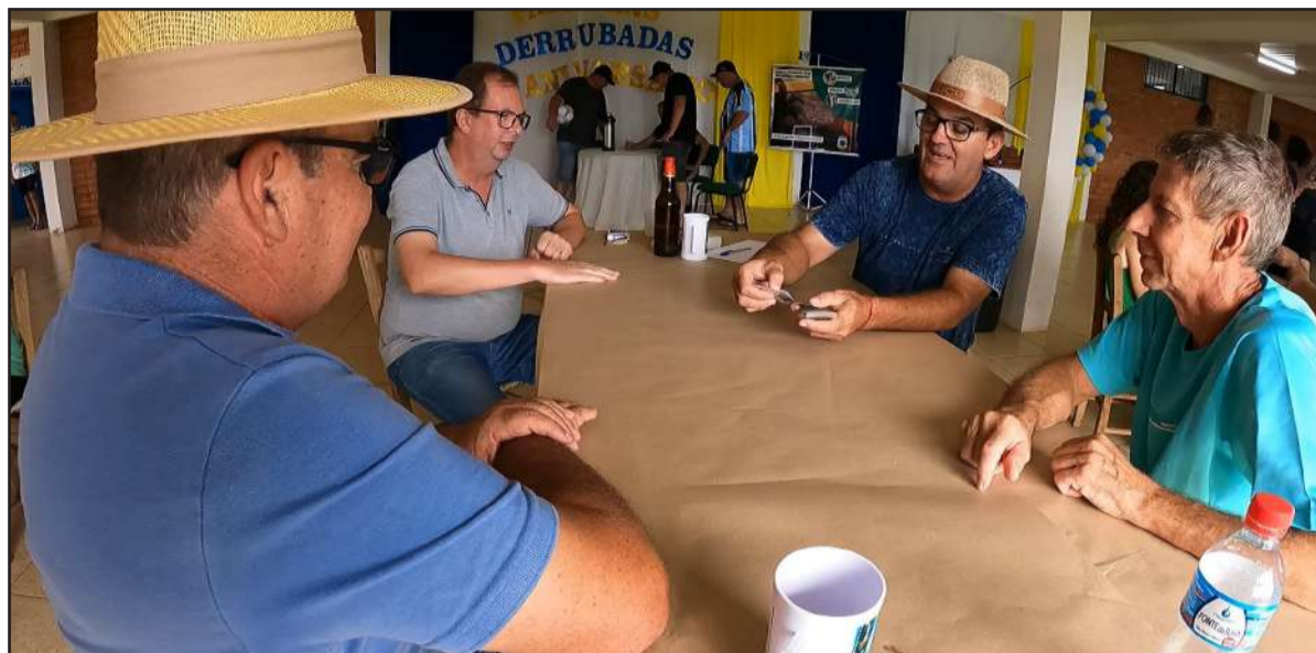
Jogos foram disputadas em diversas modalidades

No último sábado, 9 de março, Derrubadas celebrou a 32ª edição dos Jogos de Integração entre funcionários municipais, evento que se tornou uma tradição no município. Realizado no Centro Esportivo Municipal, o dia foi marcado por momentos de celebração, interação e competição saudável entre os colaboradores municipais.