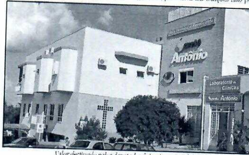
Valor destinado pelos deputados federais soma R$ 400 mil

as outras instituições filantrópicas e comunitárias no meu estado. Agora vou trabalhar para que os recursos sejam liberados o mais rápido possível pelo governo, pois essas instituições não po-