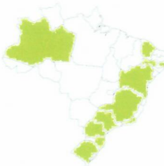
Figura 1 - Soluções RCA em território nacional

Estamos localizados em Chapecó/SC, atuamos em todo território nacional. Em sua próxima necessidade conte com a RCA.