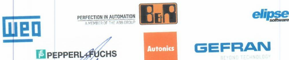
Figura 2 - Parceiros Tecnológicos RCA