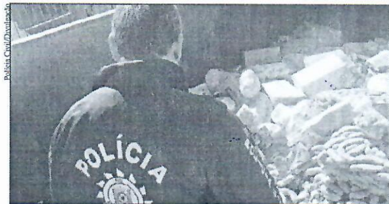
Alimentos impróprios foram recolhidos em três estabelecimentos

No decorrer da operação, conforme a Polícia Civil, foram verificadas diversas irregularidades nos supermercados vistoriados, como a venda de produ-