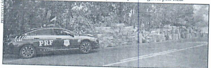
A PRF apreendeu 250 mil maços de cigarros no local

MUNICÍPIO DE VISTA GAÚCHA - RS AVISO DE LICITAÇÃO PREGÃO PRESENCIAL Nº 28/2020. OBJETO: Aquisição de combustíveis para uso da frota municipal. JULGAMENTO: 06/08/2020 às 08h:30min. Local: Centro Adm. Mun., sito a Av. Nove de Maio, 1015. Informações: No Centro Adm. Mun., fone (55) 3552-1022, site www.vistagaucha-rs.com.br e e-mail compras@vistagaucha-rs.com.br. Vista Gaúcha, RS, 24/07/2020. CELSO JOSÉ DAL CERO, Prefeito Municipal