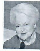
Olivia de Havilland

Além de ator, Ruiz trabalhava como radialista, locutor e dublador. Ele deixa três filhos. O velório e o enterro foram realizados no Cemitério Municipal de Poá, interior de São Paulo.