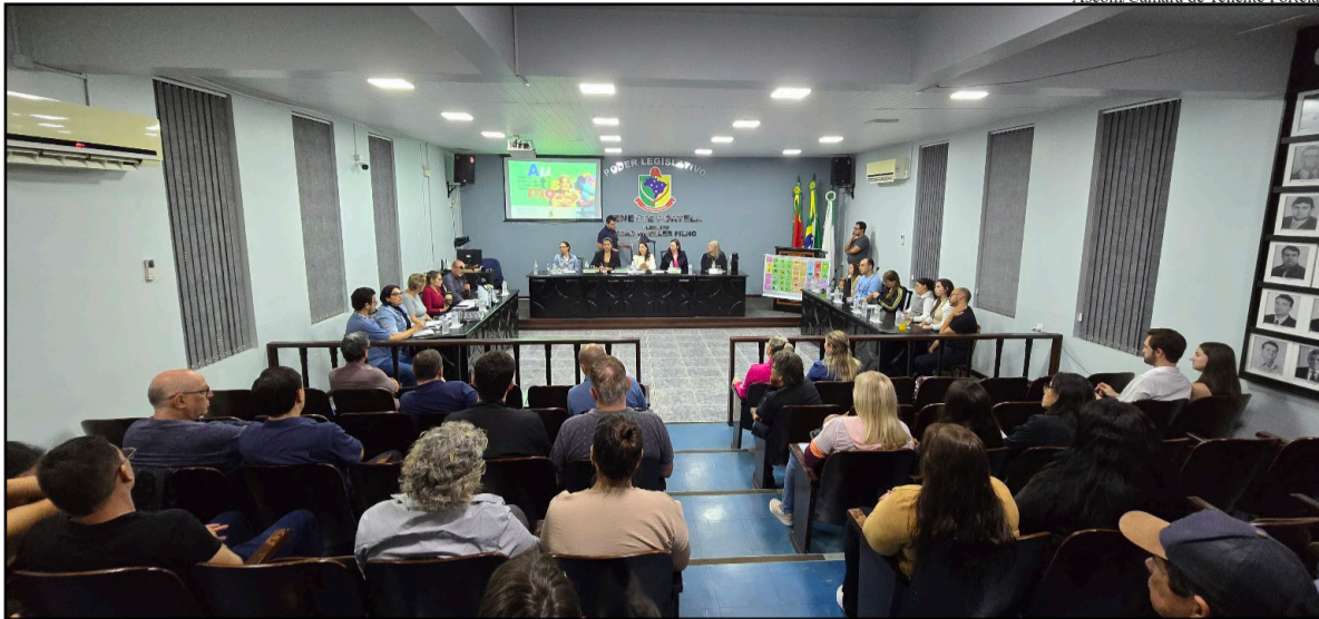
Ascom/Câmara de Tenente Portela