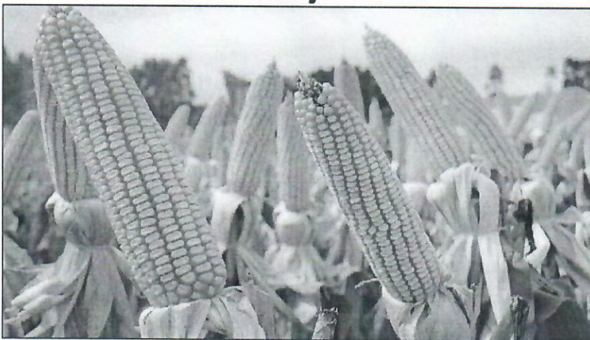
A suspensão temporária do imposto de importação para soja valerá até 15 de janeiro de 2021

Dois dos principais grãos da agricultura nacional – soja e milho – terão a alíquota do imposto de importação zera da fim de manter o equilíbrio na oferta desses produtos no mercado doméstico. A decisão foi tomada pelo