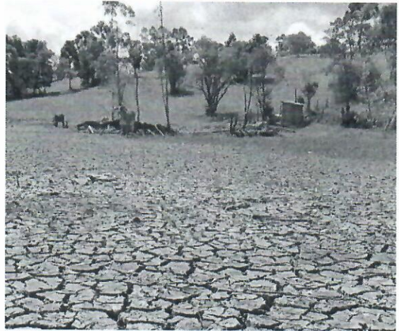
Fortes da estiagem deve atingir o estado entre dezembro e janeiro

Segundo dados da MetSul, o fenômeno La Niña atua desde agosto no Oceano Pacífico Equatorial e deve seguir impactando o clima do Sul do Brasil durante os próximos meses. Hoje, o La Niña tem intensidade moderada, mas a expectativa é que entre dezembro e janeiro atinja forte intensidade trazendo estiagem.