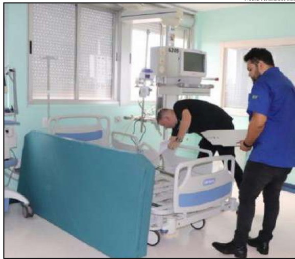
Ainda em dezembro, a rede pública passa a contar com mais 190 vagas distribuídas em hospitais das sete macrorregiões do Estado

Para equipar os hospitais gaúchos, a SES comprou conjuntos de 230 respiradores e monitores por meio de pregão eletrônico, no valor de R$ 17 milhões. Do Ministério da Saúde foram recebidos 853 equipamentos. Também foi efetivada uma parceria com a GM e com o Instituto Cultural Floresta