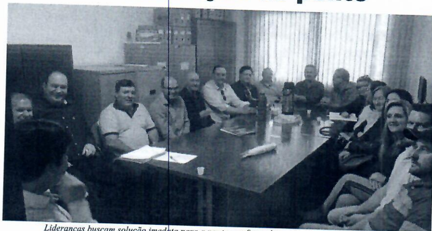
Lideranças buscam solução imediata para a ponte que fica sobre o Rio Guarita na ERS-330

Uma reunião envolvendo autoridades de diversos municípios da Região, representante do senador Luis Carlos Heinze e 17ª superintendência regional do Departamento Autônomo de Estradas de Rodagem DAER – de Palmeira das Missões, debateu a situação da ponte localizada sobre o leito do Rio Guarita na RS-330 entre Redentora e Dois Irmãos das Missões.