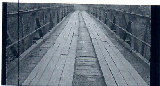
Estrutura da ponte é de metal com piso de madeira

O encontro foi muito produtivo e, em breve as providências definidas serão tomadas, para que essa importante obra se concretize, com maior brevidade possível.