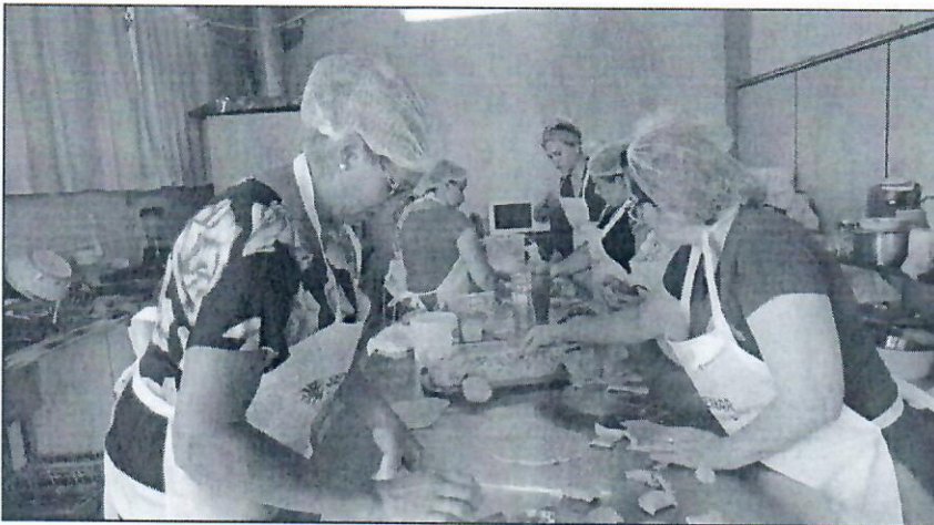
Curso foi ministrado pelo SENAR-RS e acompanhado pela equipe técnica do CRAS de Derrubadas