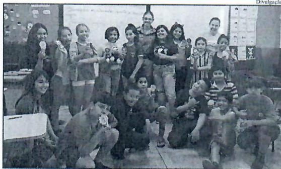
empresas parceiras, autoridades e comunidade em geral estarão reunidos celebrando a formatura dos alunos.

No próximo dia 20 de Novembro acontecerá a solenidade de formatura dos alunos, na cripta da Igreja Católica. Nesse dia pais, alunos, professores,