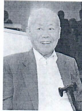
Ling morreu aos 99 anos

A partir de 1955, começou a evolução dos seus negócios dando origem a um conglomerado industrial. Um dos prin-